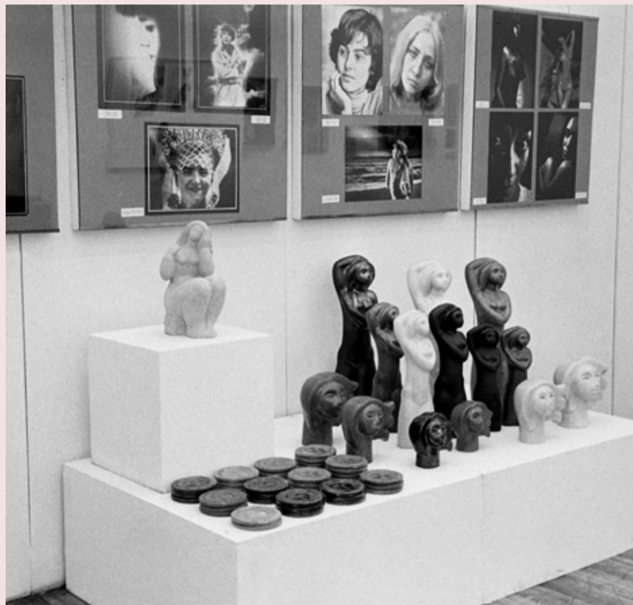
Naine Fotokunsti 1983 enne avamist ja preemiade üleandmist.