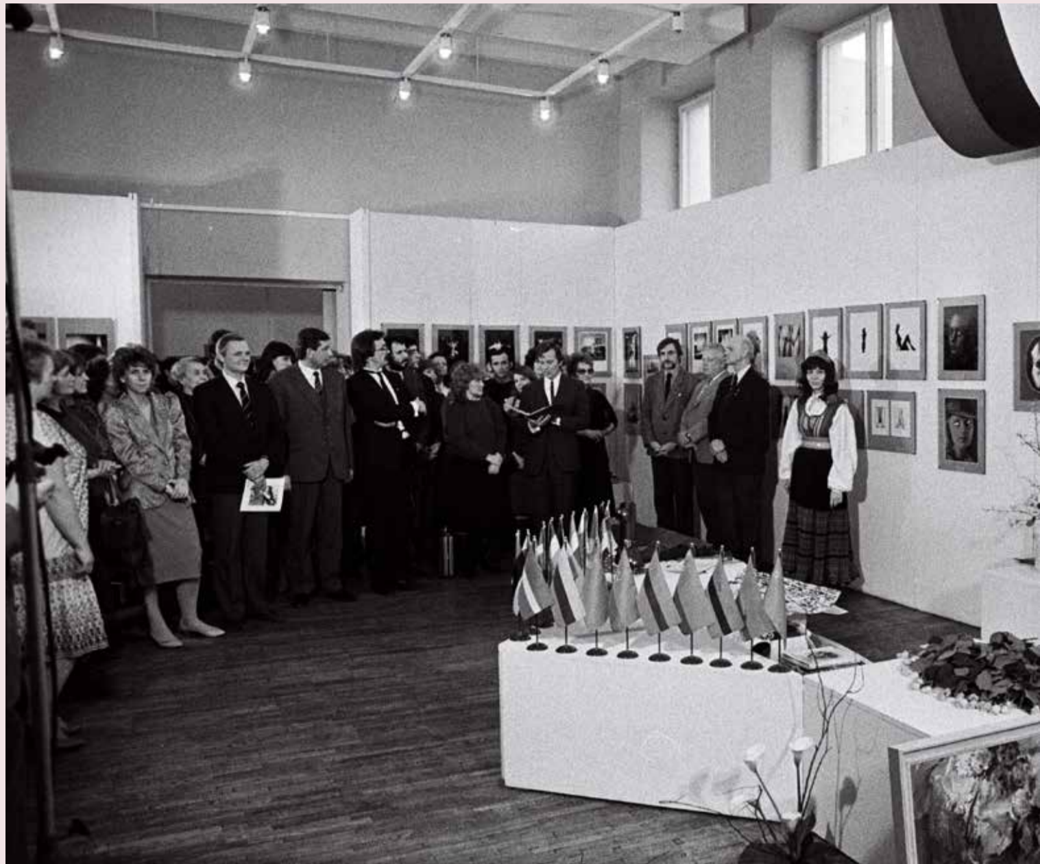
Naine Fotokunsti 1989 avamine.

Näituse sisuga seotud poliitilistele probleemidele viitab ka asjaolu, et arhiivis