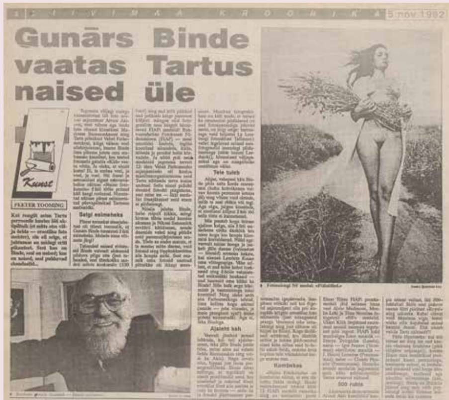
Liivimaa Kroonika 5.11.1992.