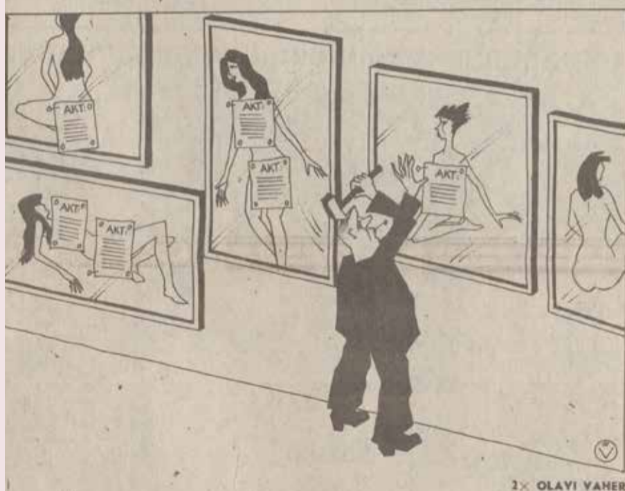
Edasi 7. marts 1986.