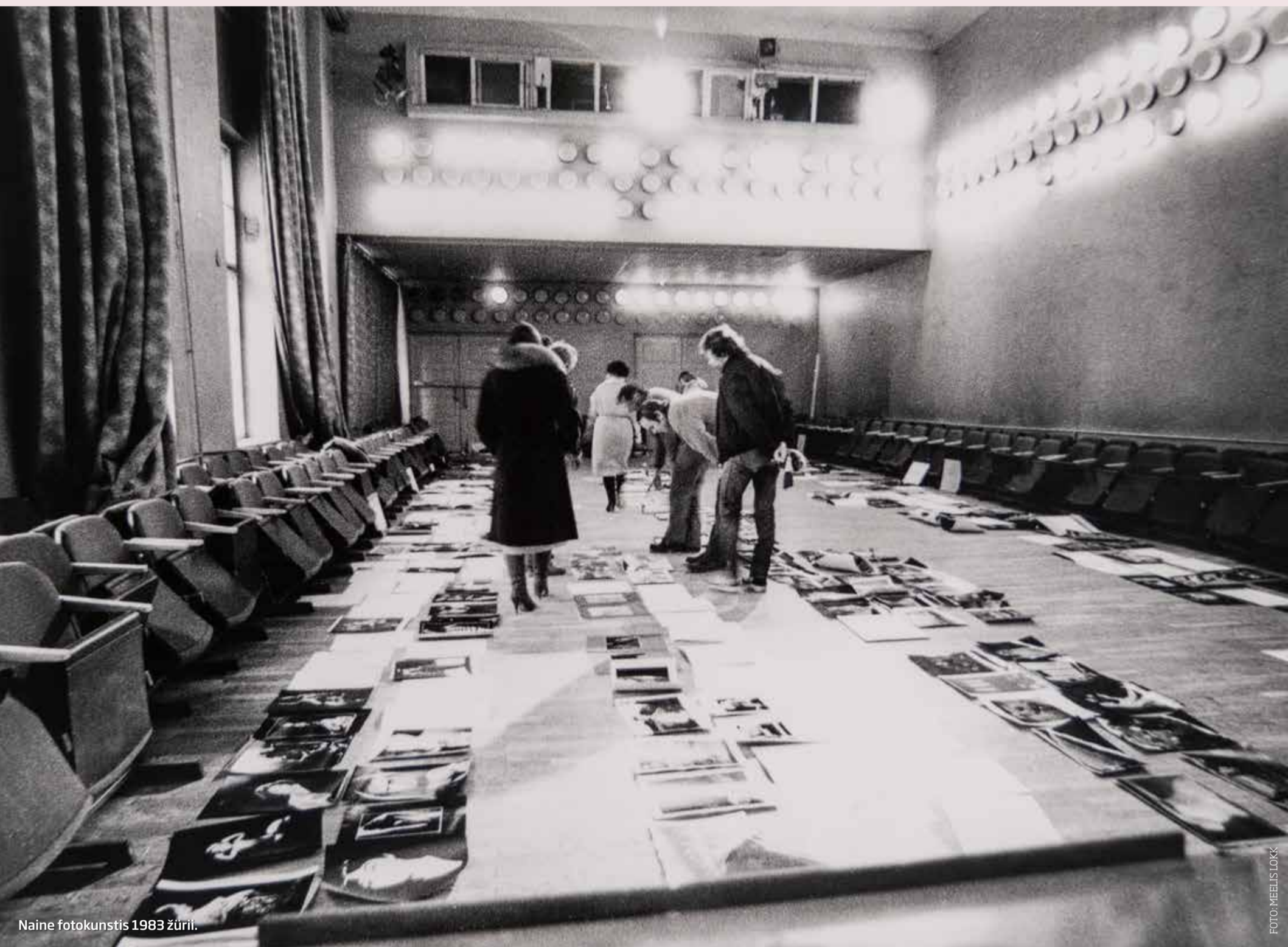
Naine fotokunstis 1983 žürii.