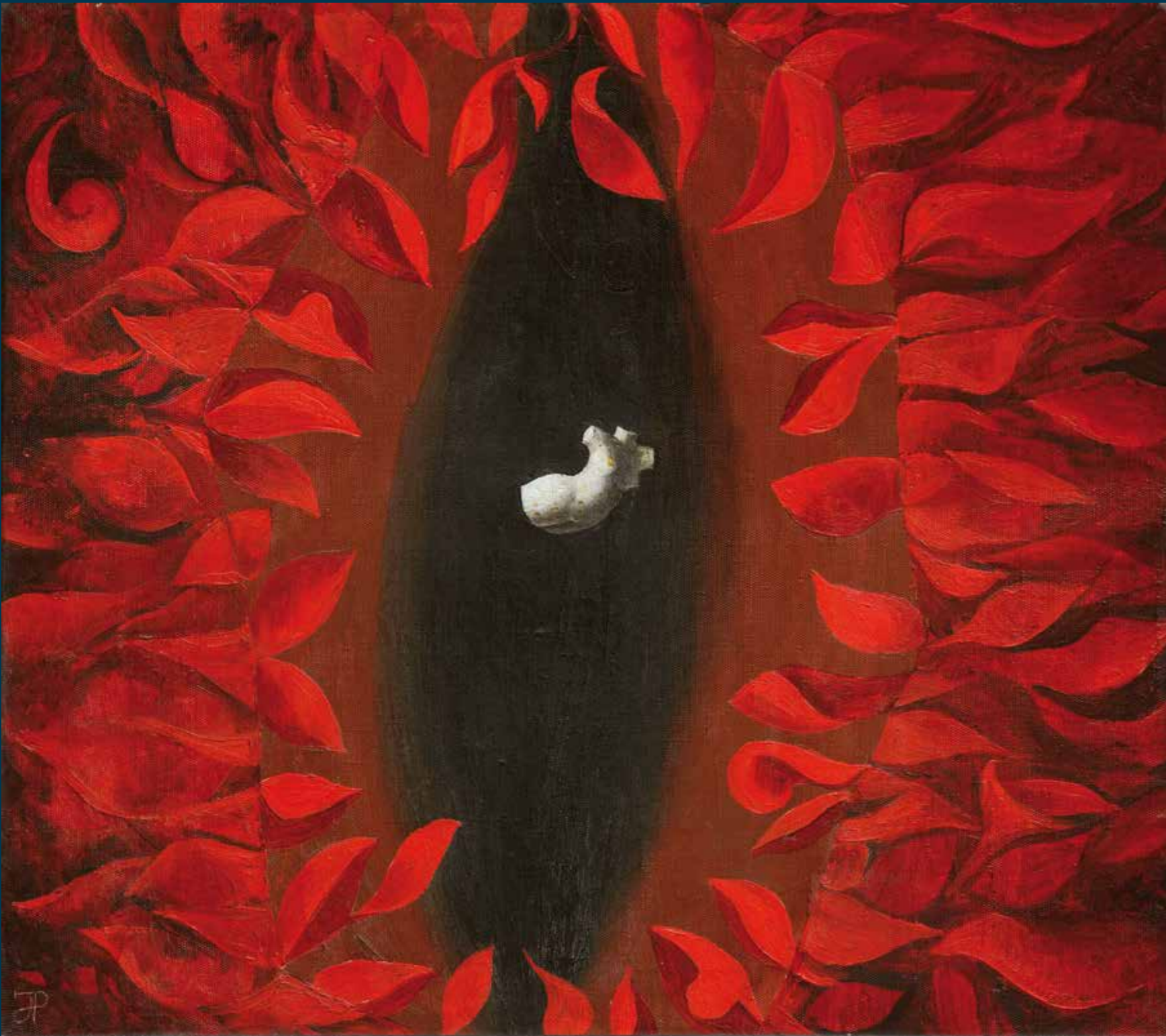
Jüri Palm Lüüriline juhtum, 1967, õli, lõuend, 55 x 62 Lyrical Incident, 1967, oil on canvas, 55 x 62