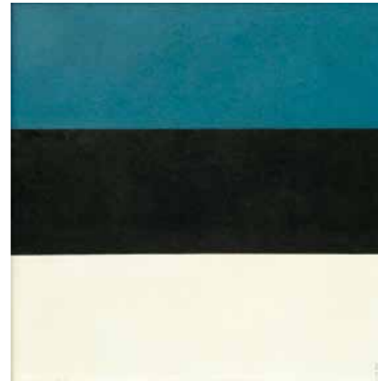
René Kari, Sinine, must ja valge, 1988, õli, kartong, 45 x 45 René Kari, Blue, Black and White, 1988, oil on cardboard, 45 x 45

series "Blue, Black and White" (1988) is in the collection and even this has required much detective work on the part of Punab. The blue-black-white painting comprising three sections in varying sizes was exhibited in March 1988 at the artist's solo show at Draakon Gallery from where the KGB forced their removal. The same series was shown